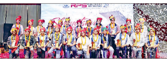
रेवाड़ी। बच्चों को सम्मानित करते हुए।

शिक्षा के क्षेत्र में अपनी सर्वोच्चता और गुणवत्तापूर्ण अध्यापन के लिए विख्यात आरपीएस ग्रुप ऑफ स्कूल में मंगलवार को श्रेयोत्सव अभिनंदन समारोह का आयोजन किया गया। जिसमें दसवीं व बारहवीं की बोर्ड परीक्षा के रिजल्ट में बेहतरीन प्रदर्शन करने वाले छात्रों को सम्मानित किया गया। छात्रों को पगड़ी व फूल मालाएं पहनाकर खुली जीप में डोल