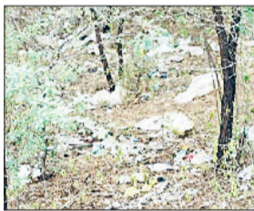
अरावली वन क्षेत्र में डाला जा रहा कचरा।

अरावली वन क्षेत्र में खोल की घाटी में भारी मात्रा में कचरा डाला जा रहा है। लोगों ने इस वन क्षेत्र को डंपिंग यार्ड की तरह यूज करना शुरू किया हुआ है, जिससे पेड़ों के बीच कूड़े के ढेर लगे हुए हैं। वन विभाग की ओर से इस दिशा में ठोस कदम नहीं उठाए जा रहे हैं। शादी व दूसरे समारोह में लोग प्लास्टिक व थर्मोकॉल से बने बर्तनों का इस्तेमाल करते हैं। यूज करने के बाद डिस्पोजल आइटम ट्रैक्टर ट्रॉलियों में भरकर खोल के आसपास पहाड़ों