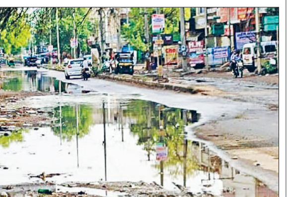
रेवाड़ी। बावल रोड पर काफी दूर तक एकत्रित बरसाती पानी।

बरसाती पानी निकासी के लिए बनाए गए नाले इस समय गाद और कूड़े से भरे हुए हैं। इन नालों की नियमित सफाई नहीं होने से बारिश होते ही पानी सड़कों और निचले इलाकों में एकत्रित हो जाता है। कुछ स्थानों पर नालों की सफाई का कार्य शुरू तो करा दिया गया है, लेकिन इसे पूरा होने में अभी काफी समय लग सकता है। इस दौरान अगर और बारिश होती है, तो लोगों के लिए शहर की सड़कों से निकलना तक मुश्किल हो जाएगा।