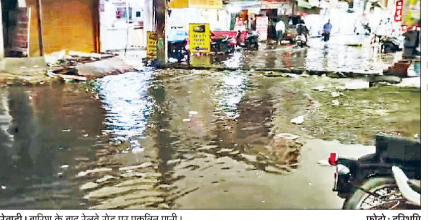
रेवाड़ी। बारिश के बाद रेलवे रोड पर एकत्रित पानी।