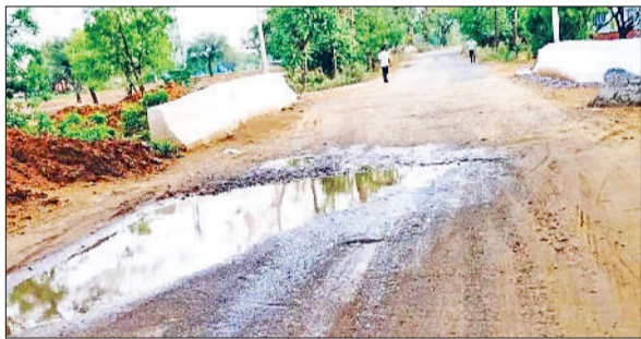
रेवाड़ी। पुल निर्माण के बाद टूटी सड़क के गड्ढे में एकत्रित पानी व सड़क पर पड़ी मिट्टी।

कुंडा। पुलिस ने दहेज की मांग पर विवाहिता से मारपीट करने और जान से मारने की धमकी देने के मामले में एक आरोपी को गिरफ्तार किया है। पुलिस ने थाना क्षेत्र के एक गांव निवासी महिला की शिकायत पर दोनों पक्षों के बीच बातचीत से समझौता कराने के प्रयास किए थे।