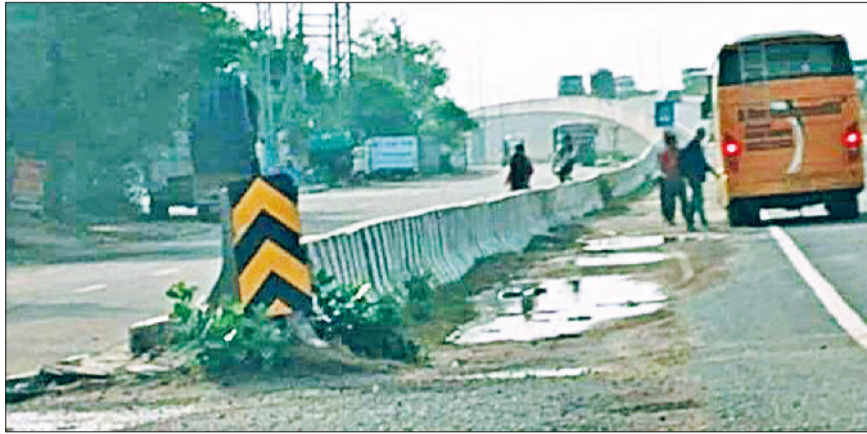
रेवाड़ी। जैसलमेर नेशनल हाइवे पर बस रोककर सवारी बैठाता बस चालक।

जैसलमेर नेशनल हाइवे पर पड़ने वाले गांवों के बस स्टॉप सर्विस रोड पर बनाए हुए हैं। मेन हाइवे पर वाहनों को रोककर सवारियां बैठाना ट्रैफिक नियमों की अवहेलना होता है। नेशनल हाइवे पर वाहनों की रफ्तार काफी तेज होती है। ऐसे में किसी वाहन के अचानक ब्रेक लगाने ही पीछे