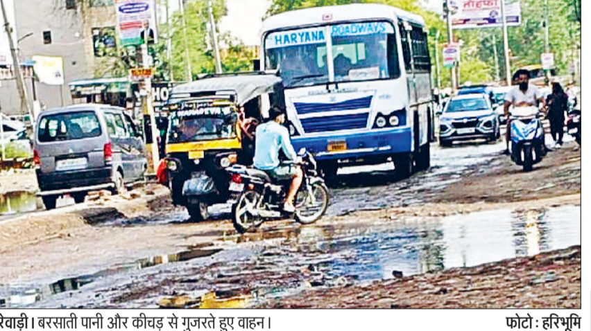
रेवाड़ी। बरसाती पानी और कीचड़ से गुजरते हुए वाहन।

हरिभूमि न्यूज ▶▶ रेवाड़ी मानसून के जून माह के दूसरे पखवाड़े तक सक्रिय होने की संभावना है। अधिकारियों की बैठक में मानसून के दौरान बरसाती पानी निकासी की समुचित व्यवस्था करने के आदेश दिए जा चुके हैं, लेकिन जमीन हकीकत इससे काफी दूर नजर आ रही है। गत वीरवार देर सायं हुई हल्की बारिश ने ही इस बात के संकेत दे दिए कि अगर भारी बारिश होती है, तो शहर के लोगों के लिए आफत खड़ी हो जाएगी। प्री-मानसून बारिश के बाद शहर में जगह-जगह जलभराव और कीचड़ ने लोगों को बुरी तरह परेशान कर दिया। शहर में मानसून के दौरान बरसाती पानी की समुचित निकासी व्यवस्था का अभाव लगभग हर साल शहर के लोगों को परेशान करता है। पानी निकासी के प्रबंधों के नाम पर हर साल करोड़ों रुपये की राशि खर्च की जाती है। बारिश का दौर शुरू होता है,