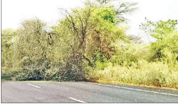
रेवाड़ी। आंधी के बाद सड़क पर टूटकर गिरा पेड़। व बारिश के बाद सड़क पर एकत्रित पानी।

नौताप के पहले चार दिनों में लोगों को घरों में दुबकने के लिए मजबूर करने वाली गर्मी वीरवार शाम हुई बारिश के बाद गायब हो गई। पांचवें दिन नौताप में ही मौसम सावन जैसा सुहाना हो गया। दूसरे दिन भी इंद्रदेवता की मेहरबानी बनी रही। कुछ इलाकों में हल्की, तो कुछ इलाकों में मध्यम बारिश हुई। अभी दो दिन तक मौसम इसी तरह बना रहने की संभावना जताई जा रही है। कई इलाकों में अच्छी बारिश भी हुई। गत वर्ष की तरह इस साल भी नौताप की तपिश पूरे 9 दिन तक बरकरार नहीं पाई। बीते वीरवार को अधिकतम तापमान 46.0 डिग्री पर पहुंचने के बाद आंधी के साथ हुई बारिश ने मौसम सुहाना बना दिया। शुक्रवार को सुबह के समय आंशिक बादल छाने के बाद आसमान साफ हो गया। अधिकतम तापमान 9.5 डिग्री की गिरावट के साथ 36.5 डिग्री सेल्सियस पर आ गया। रात का तापमान भी 5.5 डिग्री की कमी के साथ 24.0 डिग्री सेल्सियस दर्ज किया गया। हवा में नमी का स्तर 58 प्रतिशत तक आ गया, जबकि हवाओं की रफ्तार 18