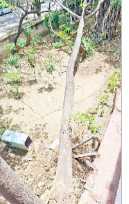
रेवाड़ी। आंधी के कारण जिला सचिवालय में टूटकर गिरा पेड़। टल गया। शुक्रवार को पेड़ को काटकर हटाया गया।

हरिभूमि न्यूज ▶▶ रेवाड़ी वीरवार सायं तेज आंधी आने के बाद जिला सचिवालय में एक भारी भरकम पेड़ टूटकर जमीन पर गिर गया। शाम के समय सचिवालय में कोई व्यक्ति नहीं होने के कारण हादसा टल गया। सचिवालय परिसर में कई पेड़ काफी पुराने हो चुके हैं। पर्यावरण संरक्षण को देखते हुए इन पेड़ों को काटा भी नहीं जा सकता। एक पेड़ आंधी आने के बाद टूटकर जमीन पर गिर गया, लेकिन आसपास कोई नहीं होने के कारण हादसा